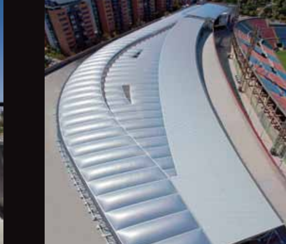
13-Церковь Св. Петра в Корбера д'Эбре. Корбера д'Эбре. Испания - 14-Аквапарк Aqualibi. Вавр. Бельгия - 15-Отель Villa de Laguardia. Лагуардиа. Испания - 16-Ресторан Les Cols. Олот. Испания - 17-Place du Saquet à Saint-Denis. Сан Дени. Франция - 18-Аквариум Пальма. Пальма. Майорка. Испания - 19-Экспосарагоса 2008. Сарагоса. Испания - 20-Дворец конгрессов. Уэска. Испания - 21-Торговый центр Arena Multiespacio. Вленсия. Испания