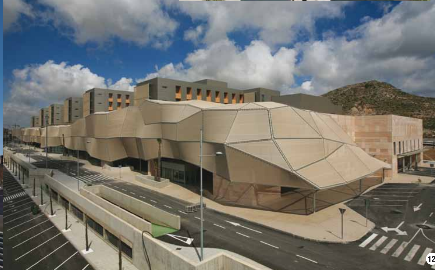
1-Торговый центр Vallsur. Вальядолид. Испания - 2-Magical Media. Льерида. Испания - 3-Купол площади Milenio. Вальядолид. Испания - 4- Люксембургский центральный вокзал. Люксембург - 5- Торговый центр Islazul, Мадрид. Испания - 6-Центральные офисы IASO. Льерида. Испания - 7- Торговый центр El Tiro. Мурсия. Испания - 8-Бизнес центр Las Mercedes. Мадрид. Испания - 9-Стадион Allianz Riviera. Ницца. Франция - 10-Центральные офисы Iguzzini. Сант Кугат. Испания - 11-Стадион San Mamés. Бильбао. Испания - 12-Госпиталь Santa Lucía. Картахена. Испания -