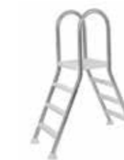
Escalera inox con plataforma de: 1,10 / 1,20 / 1,50 m