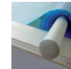
Tubo enrollador HORS-SOL D401