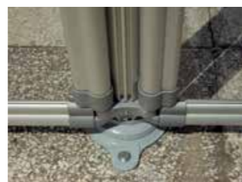
Pie. Perfiles con articulaciones