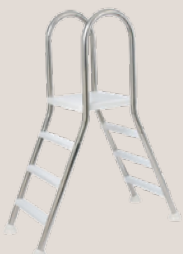
Échelle: 1,10 m / 1,20 m / 1,50 m