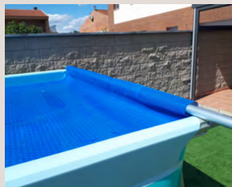
Tube enrouleur HORS-SOL D401